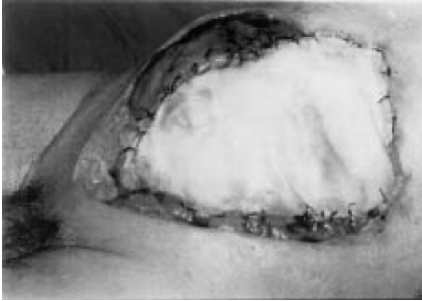
Fig. 1. Mionecrosis poscirugía cólica por Clostridium . Desbridamiento y contención temporal.

oscuro con formación de gas, con exudado serosanguinolento. Asimismo, se observan placas de necrosis de color verde oscuro con flictenas de olor fétido intenso agrídule.