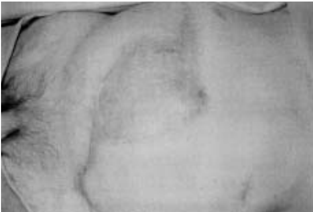
Fig. 4. Epitelización a los 2 meses de retirar la prótesis.

previa exéresis de las láminas de linitul.