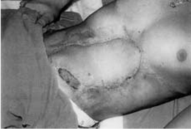
Fig. 3. Reconstrucción con injerto libre miocutáneo del dorsal ancho.