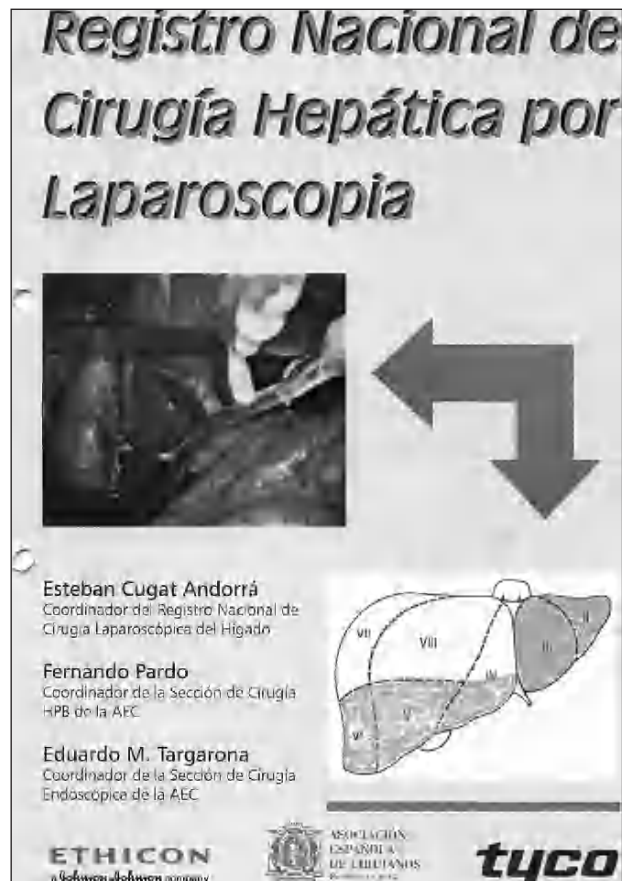
Fig. 1. Portada de la hoja de recogida de datos del Registro Nacional de Cirugía Hepática por Laparoscopia.

Por otro lado, existe un teórico efecto dañino del neumoperitoneo al provocar embolias gaseosas debido al paso de CO 2 al torrente sanguíneo, ya sea a través de la superficie cruenta hepática o por la lesión de una vena suprahepática. Parece sensato tomar todas las medidas necesarias para protegerse de esta posible complicación, más aún cuando estudios con ecografía intraesofágica demuestran el paso de burbujas aéreas al territorio san-