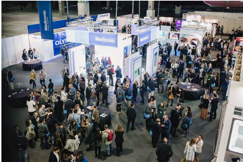
Ambiente en la zona de expositores de la XXI RNC de Málaga

La estrategia comunicativa para preparar la XXI Reunión Nacional de Cirugía en Málaga ha tenido tres fases. En primer lugar, un trabajo previo de recopilación, organización de información y elaboración de las bases comunicativas a trasladar los medios de información y, por ende, al público; una segunda fase que abarcaba la cobertura informativa durante la reunión y, por último, el post-evento con el cierre de la memoria.