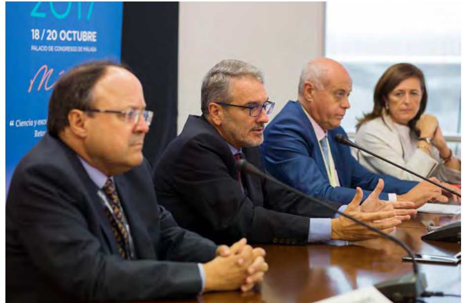
Rueda de prensa de la XXI Reunión Nacional de Cirugía