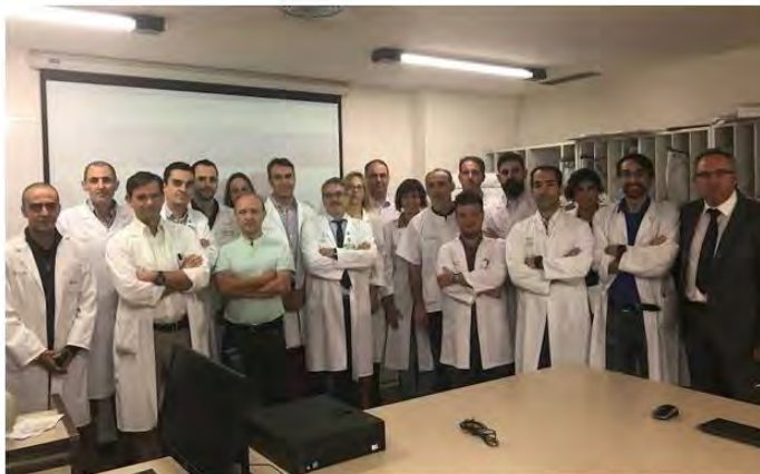
Servicio de Cirugía General, Digestiva y Trasplantes del Hospital Regional Universitario de Málaga

El congreso tratará los avances tecnológicos, la cirugía laparoscópica y las novedades en el tratamiento de tumores digestivos y mama