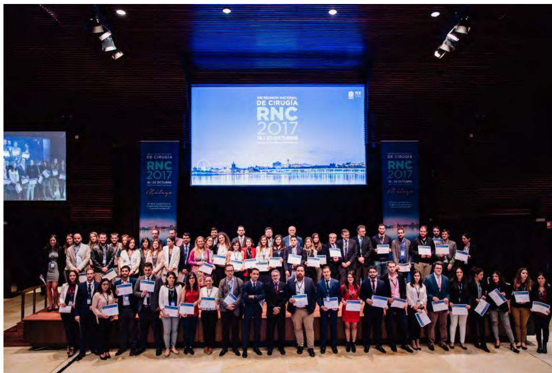
Entrega de becas de la AEC en la XXI Reunión Nacional de Cirugía

La línea de trabajo se cierra con la recopilación de toda la información y elaboración del dossier de prensa que incluye el material que se ha publicado en los medios de comunicación y la batería de fotos editada de los tres días de la XXI Reunión Nacional de Cirugía.