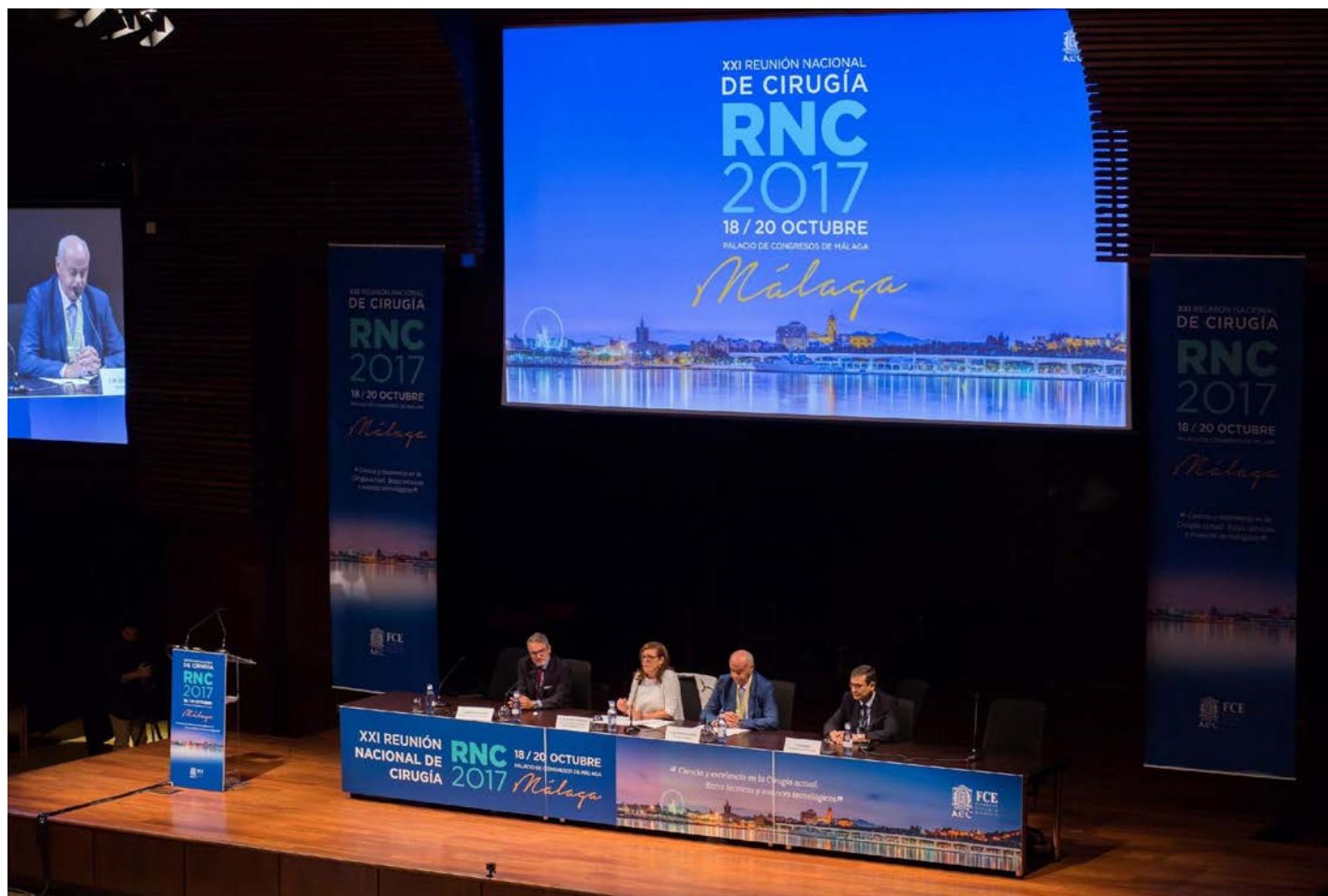
Inauguración de la XXI Reunión Nacional de Cirugía en Málaga