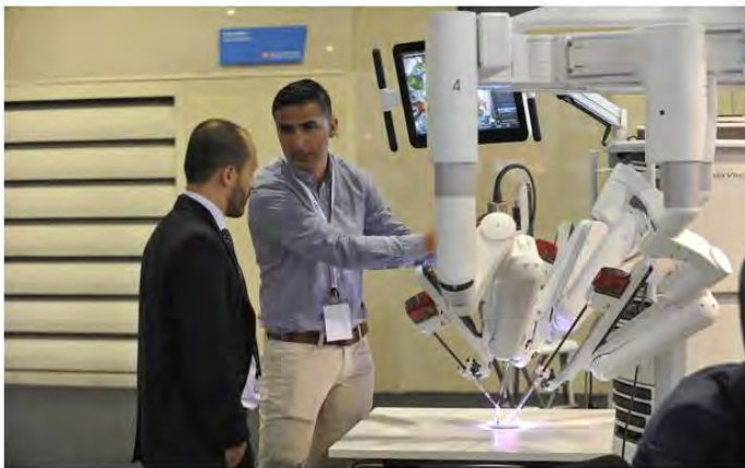
Un expositor de cirugía

La ocupación hotelera de la capital se incrementa hasta un siete por ciento con los huéspedes de este tipo de reuniones